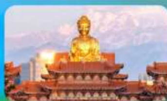
วัดพระใหญ่หวงกงชาน