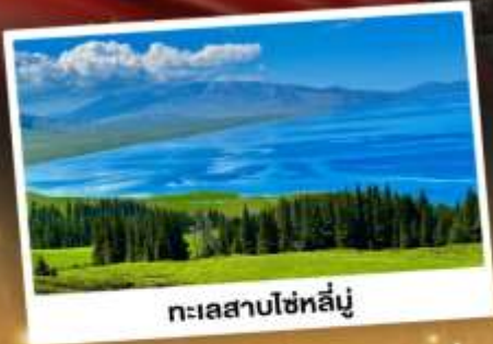
ทะเลสาบไซทาลี

ชมวิวดอกคังการแบบยุโรปผสมเอเชีย กุ้งหนุ่ยเขียวดำ ทะเลสาบสีเทอร์ควอยซ์