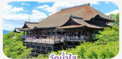
วัดน้ำใส