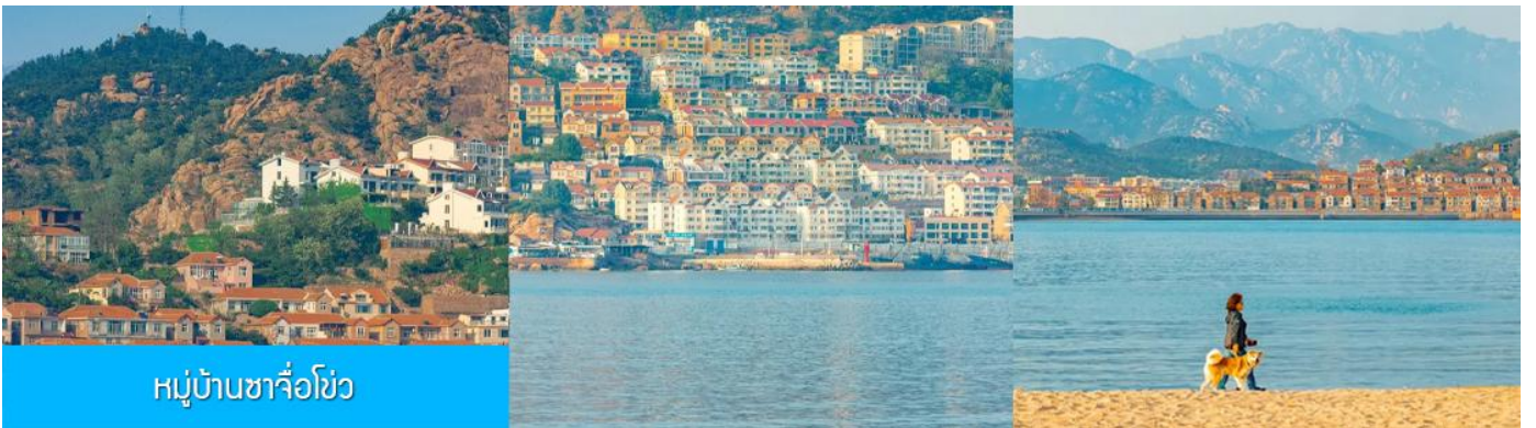
หมู่บ้านซาจื่อโจ้ว

เช้า รับประทานอาหารเช้า ณ ห้องอาหารของโรงแรม (4)