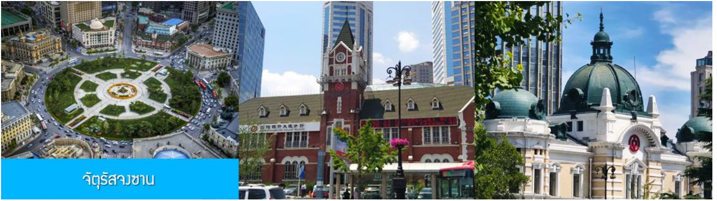
จัตุรัสสวนซาน