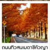
ถนนทิวสนเมตาชิคิวญา