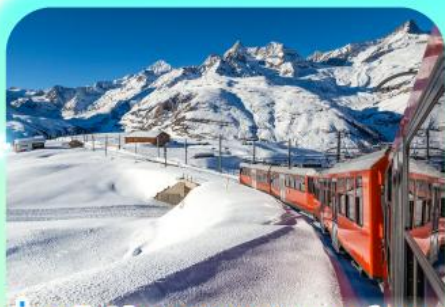
นั่งรถไฟสู่ยอดเขารอนเนอ์เกรต

สวยสะท้านฟ้าที่สวิสฯ สะกิดรักที่โดมโบ พิชิตเขาแมททอร์ฮอร์นและจุงเฟรา