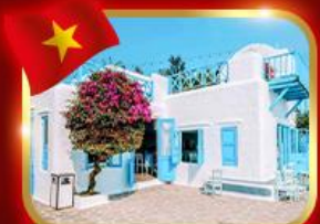
คาเฟ่สุดชิค ซานทรา มารีน่า