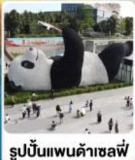
รูปปั้นแพนด้าเซลฟี