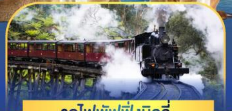
รถไฟพuffingบิลลี่

ล่องเรือชมอ่าวซิดนีย์พร้อมรับประทานอาหารกลางวัน และ เข้าชมสวนสัตว์การองก้า