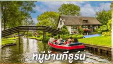
หมู่บ้านทึร์รูน