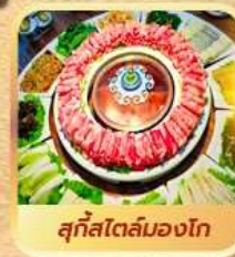
สุกีสไตล์มองโก