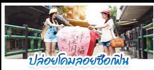
ปลั๋วยี่คอมมอยซือเฟิน