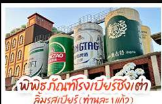
พิพิธภัณฑ์โรงเบียร์ชิงเต่า คิมรสเบียร์ (ทานคะ 1 แก้ว)