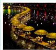
ค่องเรือมังกรแม่น้ำก้งซู่