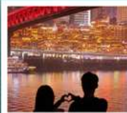
ถนนจินซาเหมิน