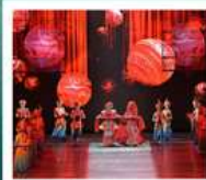
โรวีซีหลานซาตู้