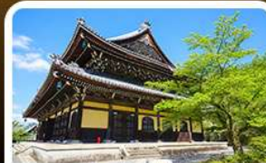
วัดนันเซ็นจิ