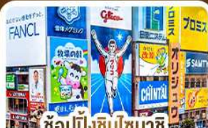
ช้อปปิ้งชินโซบาชิ และโดตงโมริ