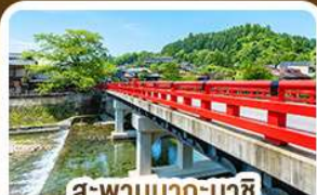
สะพานนากะบาชิ ทาคายาม่า