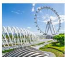
สวนสาธารณะ: OH BAY