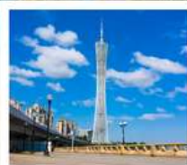
จตุรัสฮิวอิง