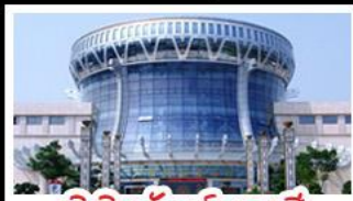
พิพิธภัณฑ์ทิวาสี

สวนสนุก FANTASYLAND - หมู่บ้านสไตล์ยุโรป พิพิธภัณฑ์ทิวาสี - ถนนคนเดินสามตรอกสองซอย ท่าเรือกิ่งจ้อ - ศาลเจ้าแม่กวนอิมพันกร เมนูพิเศษ อาหารทิวาสี , สุกีชาบูหม่าล่า