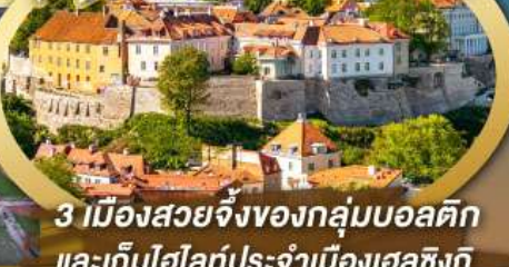
3 เมืองสวยจิ้งของกลุ่มบอลติก และเก็บไฮไลท์ประจำเมืองเอสซิงกิ และล่องเรือเฟอร์รี่ข้ามประเทศ

ไฮไลท์ในโปรแกรม • เที่ยวสามประเทศหลักกลุ่มบอลติก • ชมเมืองหลวงวิลนิอุส ประเทศลิทเวเนีย