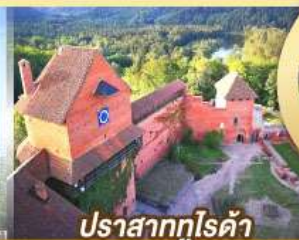
ปราสาทกูไรต้า