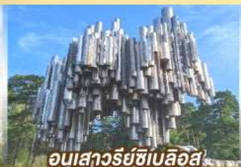
อนุสาวรีย์ซีเบิลูส