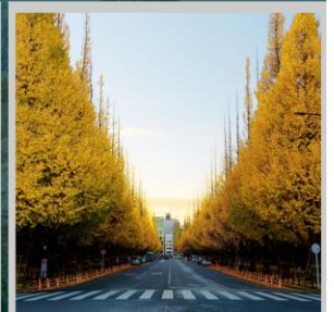
“ICHONAMIKI GINGO AVENUE”