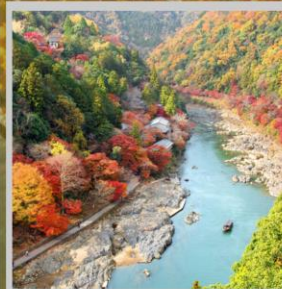
"ARASHIYAMA MT. KAMEYAMA"