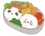
● อาหารสำหรับเด็ก ( 2-11 ปี ) *วัตถุประสงค์ขึ้นอยู่กับทาว์ราน