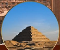
พีระมิดชั้นบันได