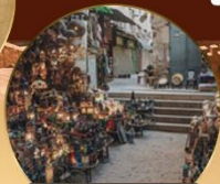
ตลาดย่านเอลคาลลี