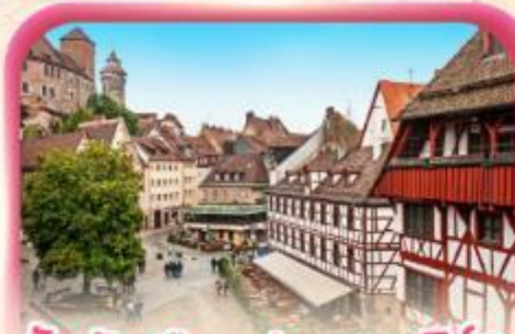
สัมผัสเมืองเก่าบูเรมเบิร์ก