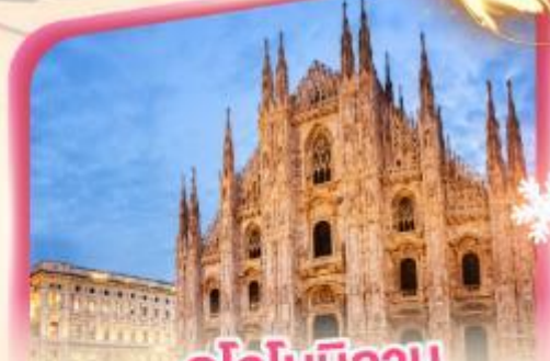
คูโอโมมิลาน