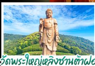
วัดพระใหญ่เฉิงชานต้าฝอ