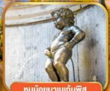
ทูน้อยมาบเทินพิส