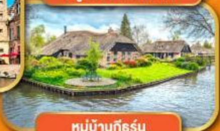
หมู่บ้านกึธร์น