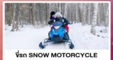
ขี่รถ SNOW MOTORCYCLE