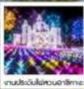
งานประดับไฟสวนอาซากุระ