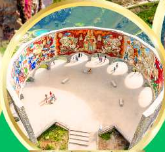
Russian-Georgian Friendship Monument