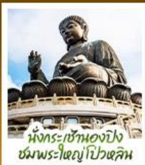
นั่งกระเช้ามองปิง ชมพระใหญ่ไถ่หุ้ย

นั่งกระเช้ามองปิงสักการะพระใหญ่ไถ่หุ้ย • วัดหวังต้าเซียน ขอพรสุขภาพ ความรัก วัดเข่งงหวีว ขอพรองค์แม่กวน โชคลาภ การเงิน และธุรกิจ • เทพเจ้ากวนไท ความซื่อสัตย์ เงินทอง ธุรกิจมั่นคง • เจ้าแม่กวนอิมรพีลัสส์บีย รับพลังงานดี เสริมพลังดวงจัญที่รพีลัสส์บีย