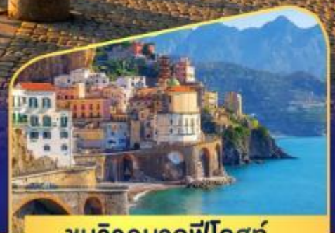
ชมวิวมอลฟีโคสก์