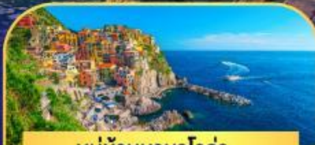
หมู่บ้านมานาโรล่า