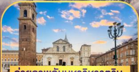
ถ่ายภาพกับมหาวิหารตูริน