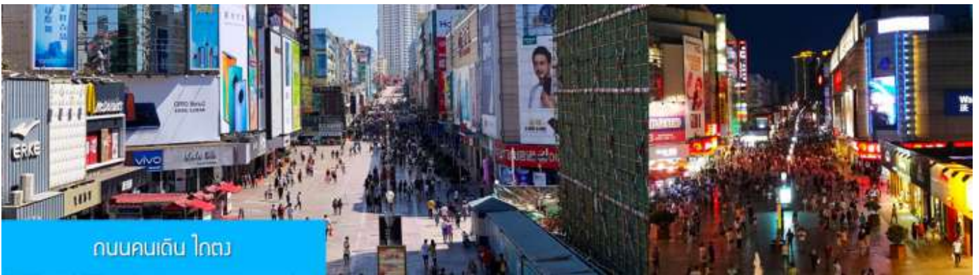
ถนนคนเดิน ไถตง

จากนั้นนำท่านเที่ยวชม โรงเบียร์ชิงเต่า 青岛啤酒博物馆 พิพิธภัณฑ์เบียร์ที่ขึ้นชื่อของเมืองชิงเต่า ซึ่งเป็นเบียร์ยี่ห้อแรกที่ผลิตขึ้นในประเทศจีน ชมเบียร์ คอลเลกชันที่มียี่ห้อหลากหลายที่สุดของโลก และชมการจัดแสดงภาพและวิทัศน์เกี่ยวกับวิวัฒนาการของเบียร์ ขั้นตอนการผลิตและอื่น ๆ ที่เกี่ยวข้อง พร้อมชิมเบียร์ชิงเต่า ซึ่งเป็นเบียร์ที่ขายดีที่สุดยี่ห้อหนึ่งของจีน.. (ชิมเบียร์ชิงเต่าท่านละ 1 แก้ว รับกลับอีก 1 ขวดเล็ก ตอนเดินออก)