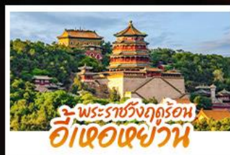
พระราชวังฤดูร้อน อี้เฮอเฉยวัน