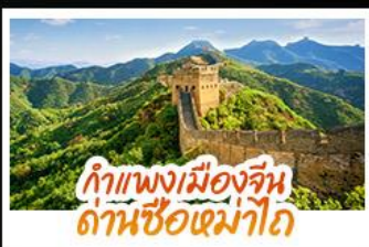
กำแพงเมืองจีน ด่านซือหม่าโต