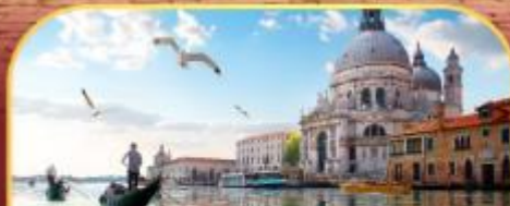
นั่งเรือสุทเกาะเวนิส