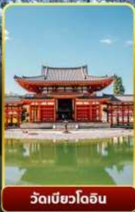
วัดเมียวโอดิน