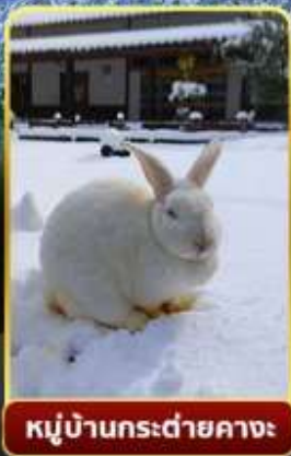
หมู่บ้านกระต่ายคางะ