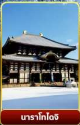
นาราโกโตจิ

พิเศษพักในเมืองคุสัทสึออนเซ็นพร้อมชมยูบาคาเกะ