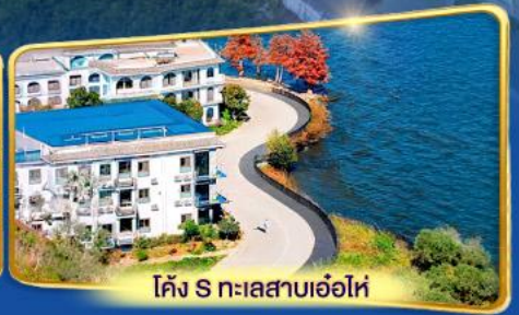
โค้ง S ทะเลสาบเอ๋อไห่