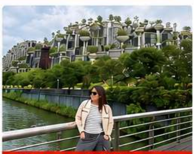
Tian an 1000trees