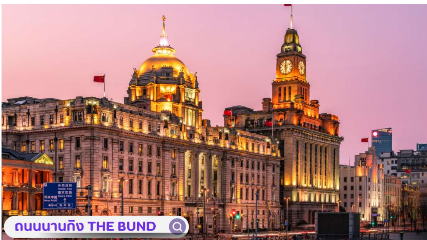
ถนนนานจิง THE BUND

ยาว 1.5 กิโลเมตร ไปตามริมแม่น้ำห้วงผู้ฝั่งตะวันตกซึ่งอยู่ในย่านเมืองเก่า หาดไ่ว่ทานยังเคยเป็นสถานที่ถ่ายทำภาพยนตร์ที่โด่งดังเรื่อง เจ้าพ่อเชียงใหม่อิสระท่านพลิดพลินที่ ถนนนานจิง(NANJING ROAD) เป็นย่านช้อปปิ้งเก่าแก่ที่สุดของเชียงใหม่ เป็นตลาดซื้อขายของกันคึกคักตั้งแต่ทศวรรษ 1920 ตั้งอยู่ฝั่งผู้ซีกินพื้นที่ยาวตั้งแต่ฝั่งตะวันตกของ “เดอะ บันด์” ถึง “พีเพิลส์ สแควร์” เป็นแหล่งช้อปปิ้งสินค้าแบรนด์เนมจากทั่วโลก และยังเป็นศูนย์รวมร้านค้าและร้านอาหารอีกมากมาย และพลาดไม่ได้กับนักจุ่มอาร์ททอยอย่างแบรนด์ POPMART GLOBAL FLAGSHIP STORE ร้านขายของเล่นที่เป็นที่โด่งดังในขณะนี้ไม่ว่าจะ LABUBU MOLLY SKULLPANDA และอย่างอื่นอีกมากมาย ให้ท่านได้เลือกลุ้นกันอย่างสนุกสนาน