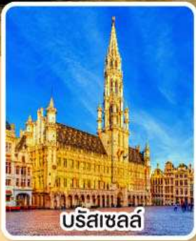
บรีซาเซลส์