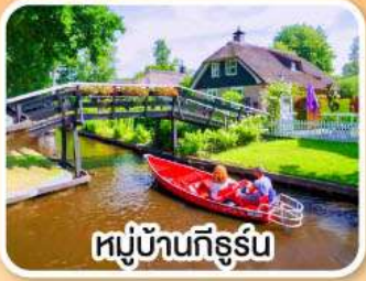
หมู่บ้านทีร์ูร์น