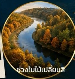
ช่วงใบไม้เปลี่ยนสี