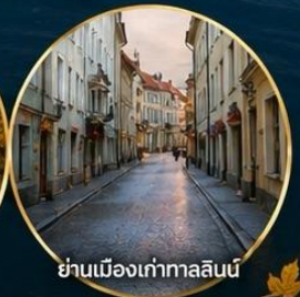
ย่านเมืองเก่าทาลลินน์