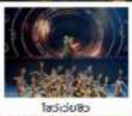
โชว์เวียงฮิว